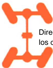
Dirección sobre los dos ejes