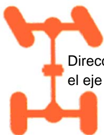
Dirección sobre el eje delantero