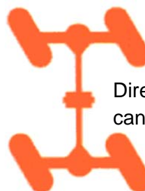
Dirección tipo cangrejo