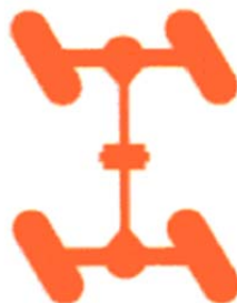
Dirección tipo cangrejo

Entre los equipos opcionales está el sistema de pesaje electrónico con impresora .