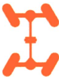
Dirección sobre los dos