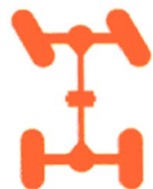
Dirección sobre el eje delantero